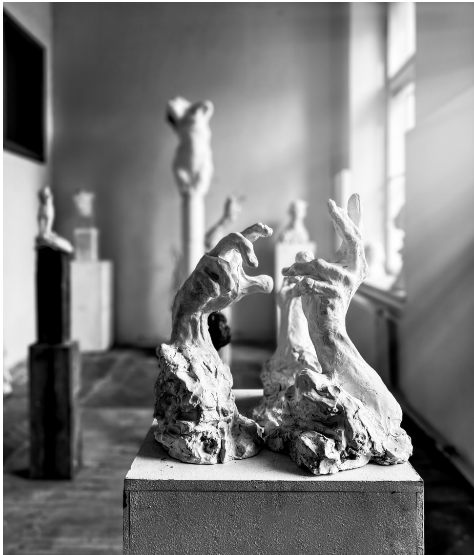
POHLED DO ATELIÉRU