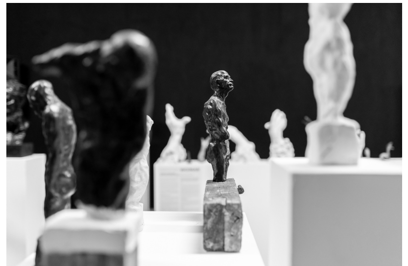
POHLED DO EXPOZICE VÝSTAVY V PRAZE 2023