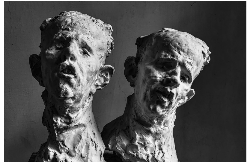
CHLAPEC Z NEMOCNICE